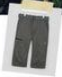
Key trends 2020